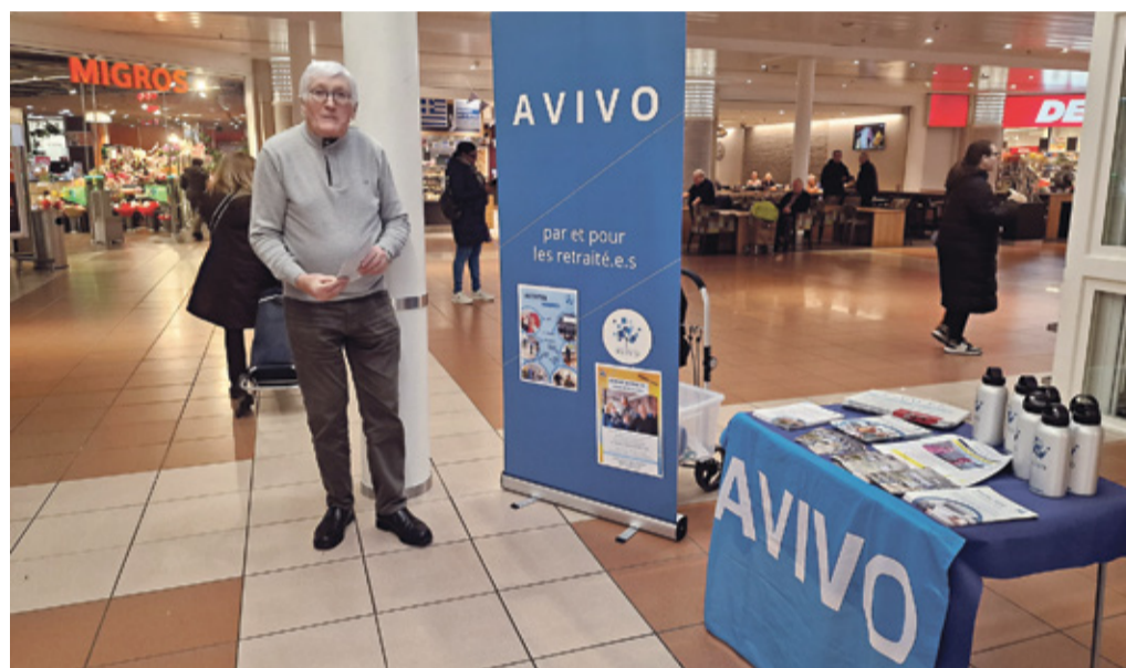
Le stand de l'AVIVO vous attend.

Vous pouvez nous contacter par courriel: evenements@avivo.ch ■