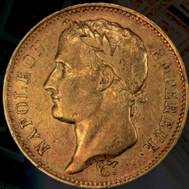
Napoléon: Métal: Or 90% Poids: 11.61g