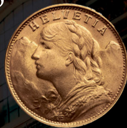
Vreneli: Métal: Or 90% Poid: 6,4g