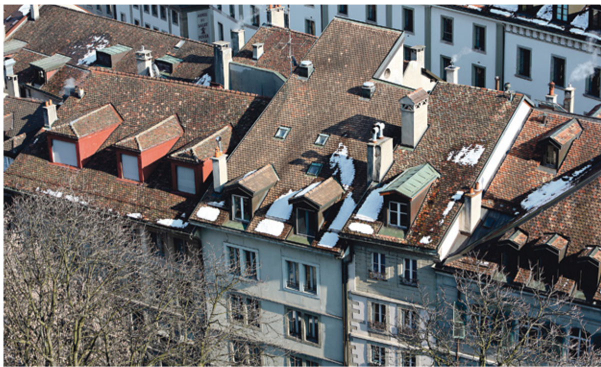
Genève: des toits magnifiques, mais des loyers qui n'en finissent pas de dérapier.

Le droit du bail, en vigueur depuis 1990, est le résultat insatisfaisant des mobilisations des années 1970 et 1980 4 . La principale faiblesse du droit du bail est qu'il laisse au locataire