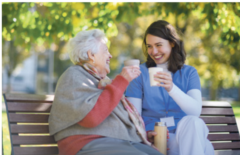
Le lien social contribue à stimuler la mémoire des seniors.

L'Université de Genève recherche des personnes de 65 ans et plus pour le projet de recherche ADVANCE. Des ateliers en groupe gratuits proposent des stratégies concrètes pour améliorer le bien-être et la mémoire au quotidien. Les programmes débuteront en avril dans le canton de Genève.