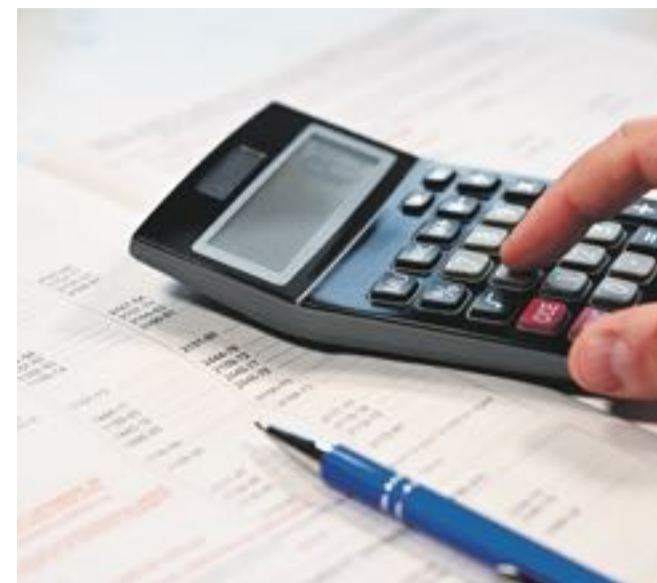
JEAN-LUC FLÉMAL - BE

Impôts par correspondance (enveloppe à envoyer à l'AVIVO) adresse: Case postale 96 / 1211 Genève 13 Il est obligatoire de mentionner dans la page de vos identifiants pour vous et chaque membre de votre famille: date de naissance; état civil; nationalité(s); profession(s) exercée(s) et numéro de téléphone.