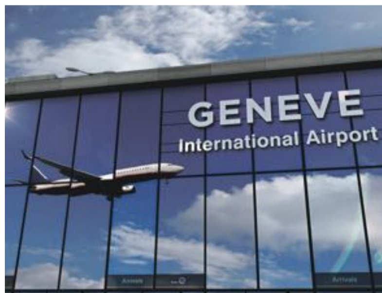
La mobilité aérienne, championne des contradictions économique et écologique.