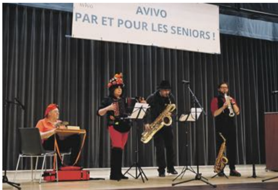
Le groupe Musicatypique a clôturé la fête dans la bonne humeur.