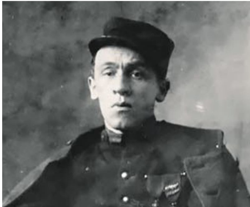
Blaise Cendrars, en 1916.