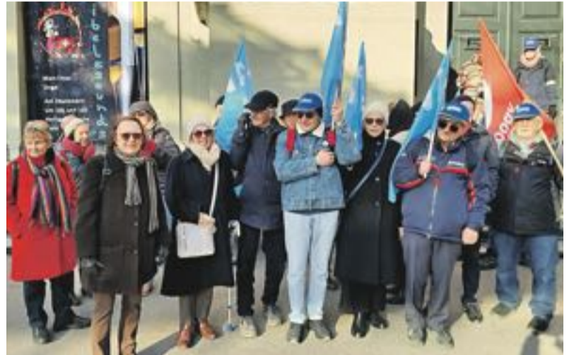
L'AVIVO était à Berne pour défendre le personnel soignant.

Il est absolument nécessaire de revaloriser ces métiers: la relève n'est pas assurée, beaucoup de professionnel-les quittent leurs emplois pour se diriger vers autre chose, écœuré-e-s par les difficultés rencontrées. Il est donc indispensable de soutenir celles et ceux qui aujourd'hui nous accueillent et nous soutiennent dans les moments difficiles. ■