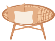
Table ronde de salon