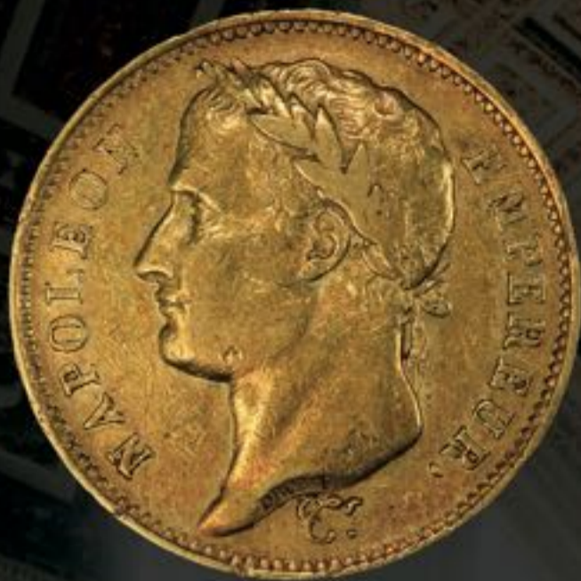
Napoléon: Métal: Or 90% Poids: 11.61g