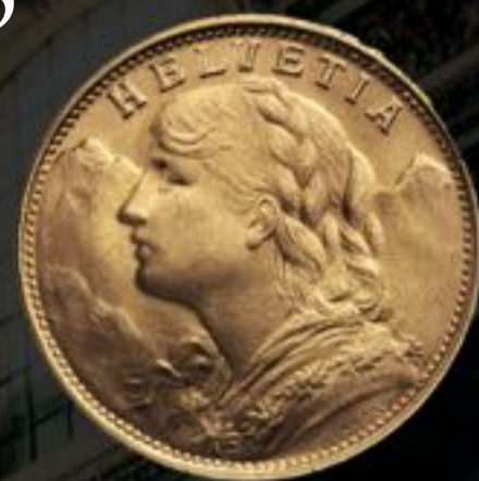
Vreneli: Métal: Or 90% Poid: 6,4g