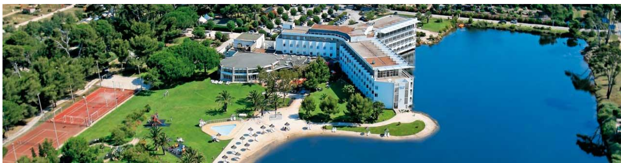
Hôtel Plein Sud