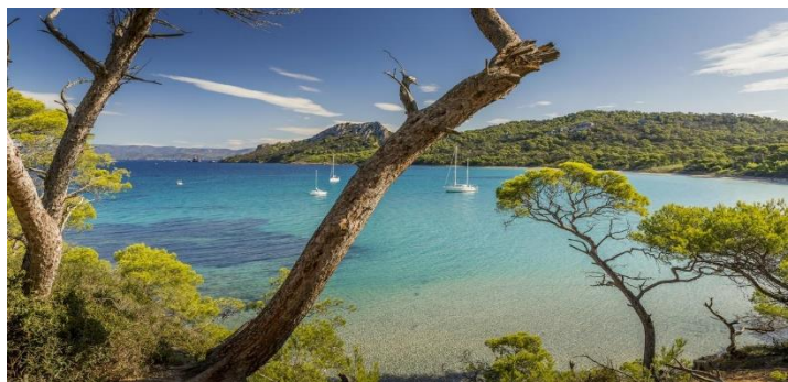
Ile de Porquerolles