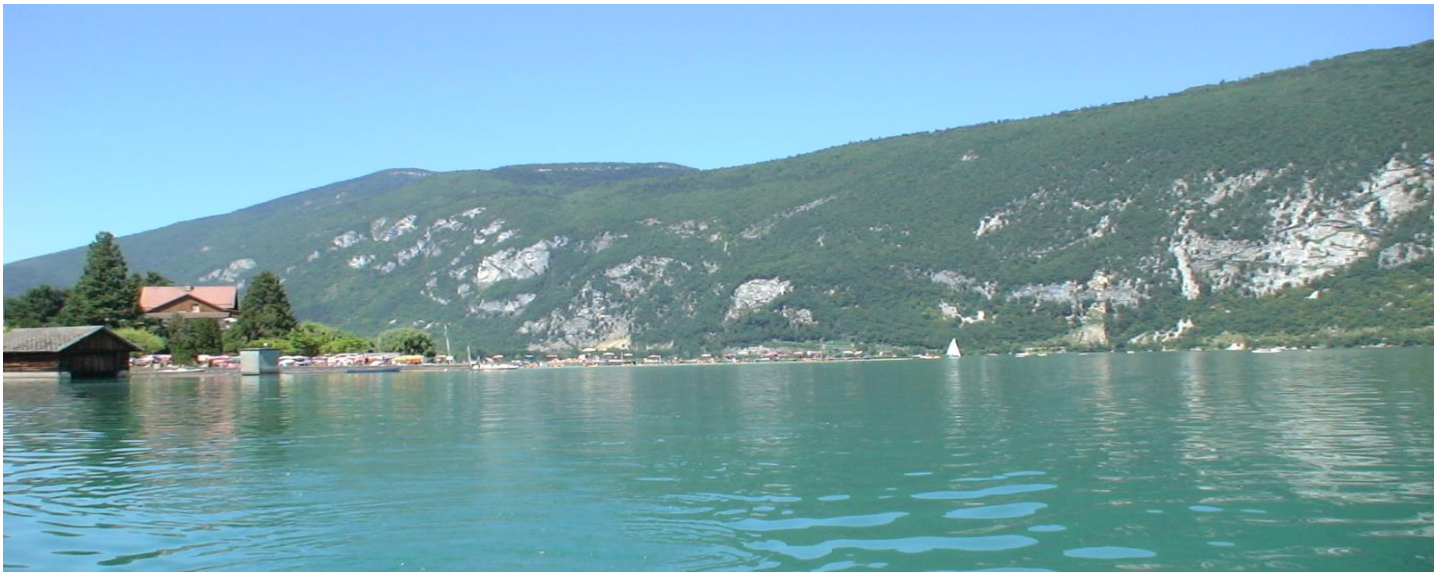
Le Lac d'Aiguebelette

Découverte de Chambéry, cité des Ducs Déjeuner au bord du Lac d'Aiguebelette